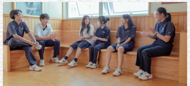
各階のコーナーにあるベンチは江南生のお気に入りスポット