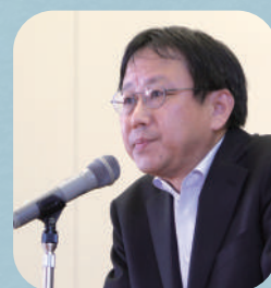
北海道釧路江南高等学校

江南高校は、これまでの教育活動をさらに充実させるため、生徒に対しては今後も"主体的に"高校生活を送るよう強く求めるとともに、生徒ひとりひとりのために、最善を尽くす教育をして参りますので、本校の教育活動に対するさらなるご理解とご支援をお願いいたします。